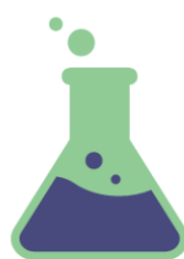
formação de bolhas