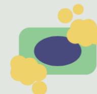
reação de sabão e detergente