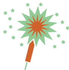
emissão de luz