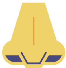
mudanças de odor