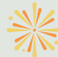
fogos de artifício