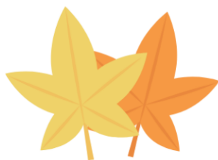
mudanças de cor